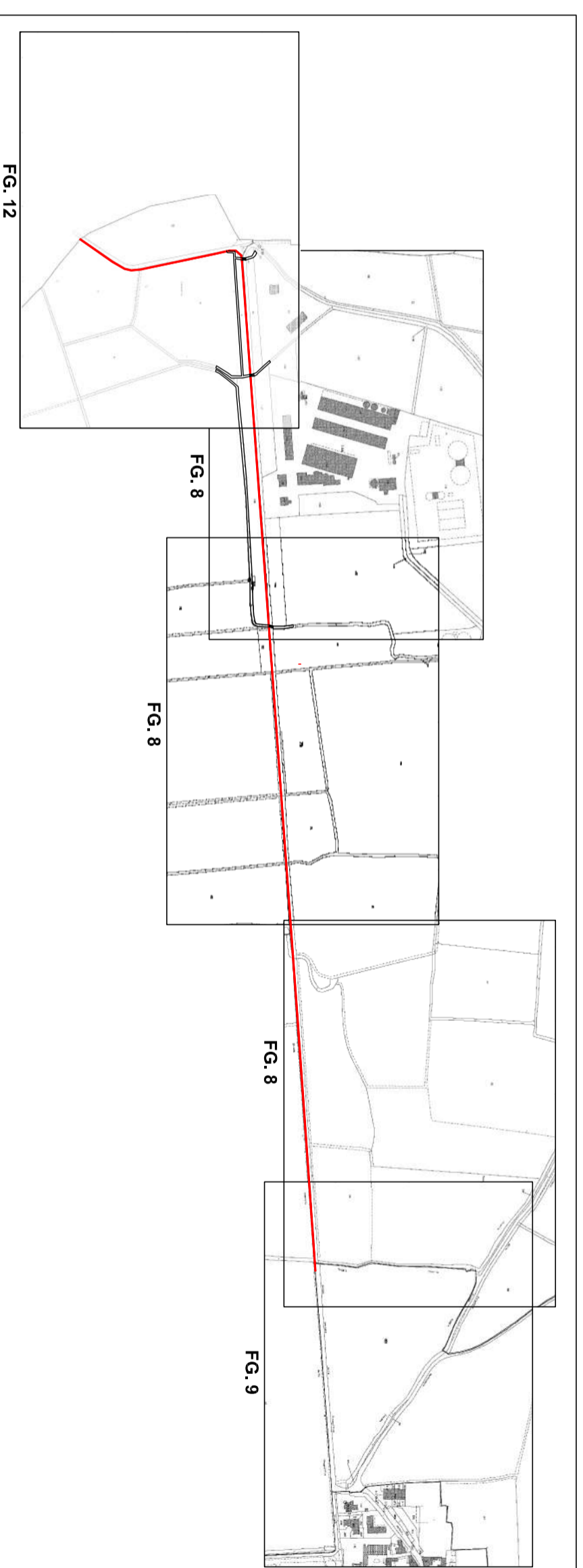
ESTRATTO DI MAPPA FG. 8-9-12