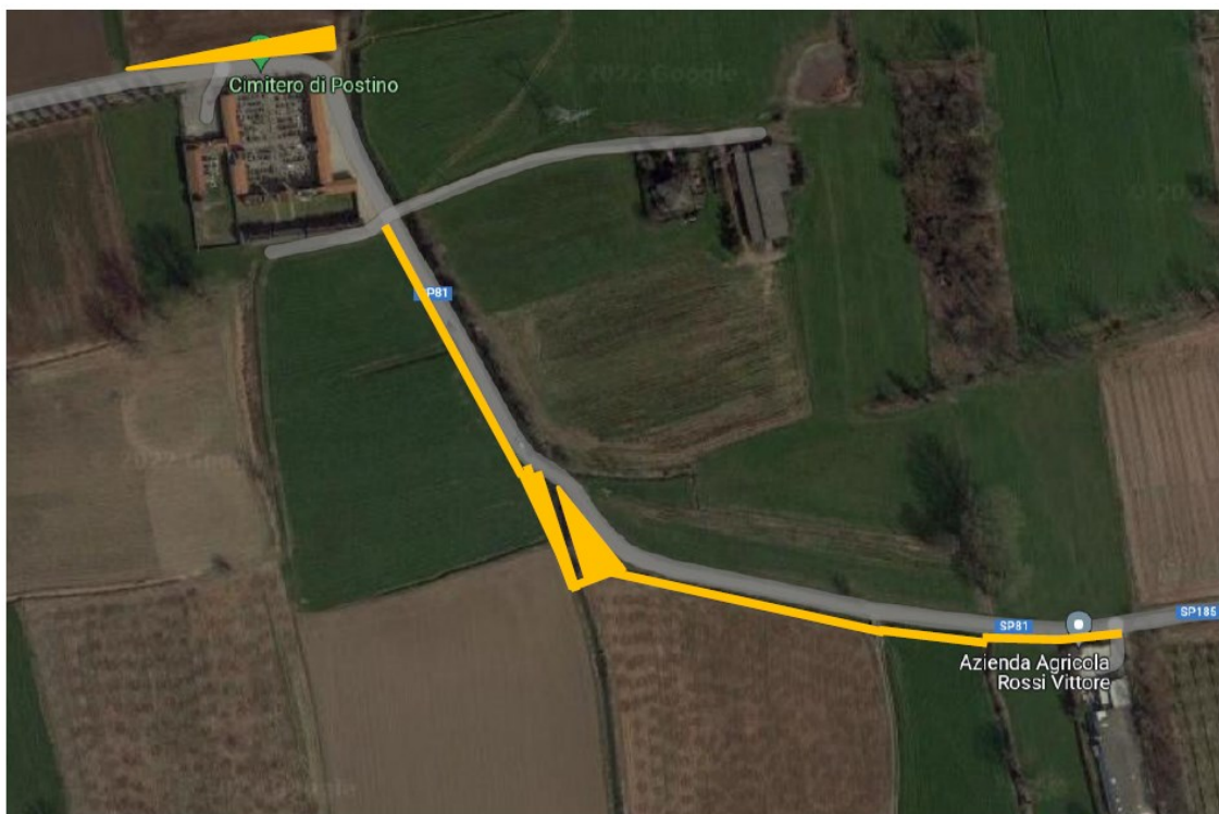
fig.1. Vista aerea del luogo con evidenziato il tracciato in progetto

Il tracciato del nuovo percorso ciclopeditonabile ha praticamente inizio dalla ciclabile esistente fronte cimitero di Postino e termina al confine territoriale dell'agro di Dovera ( fig. 1 ).