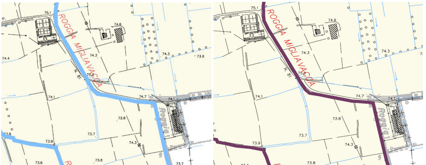
fig.4. Estratto del RIM del Comune di Dovera

Roggia Migliavacca inclusa nel Reticolo Idrico principale