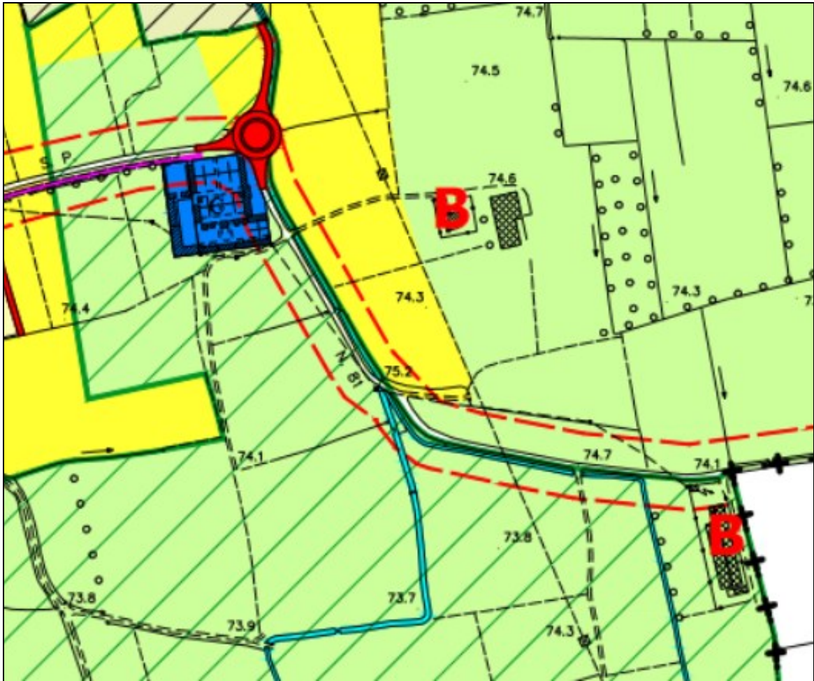
fig.3. Estratto del PdR del vigente P.G.T. del Comune di Dovera

Roggia Migliavacca inclusa nel Reticolo Idrico principale