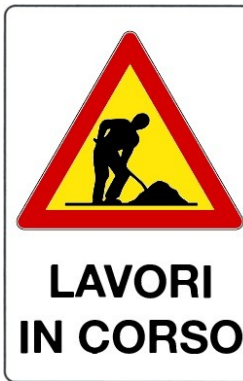
Lavori in corso