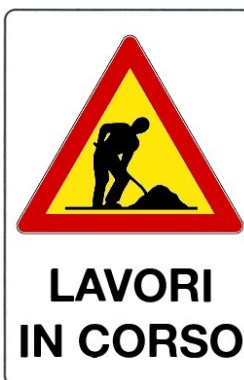
Lavori in corso