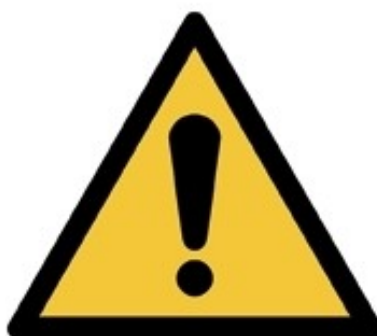
W001 - Pericolo generico