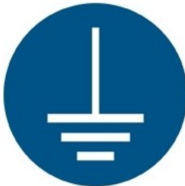
M005 - Assicurarsi del collegamento a terra