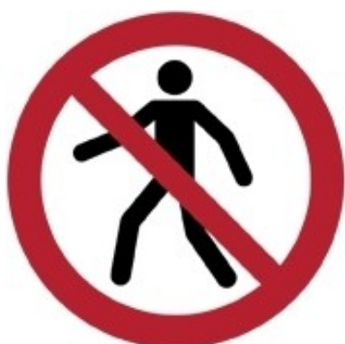
P004 - Divieto di transito ai pedoni