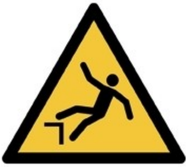
W008 - Caduta con dislivello