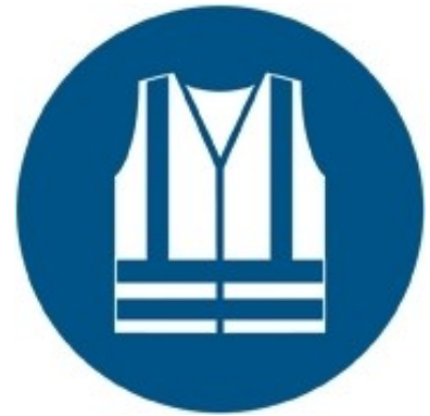
M015 - Indossare indumenti ad alta visibilità