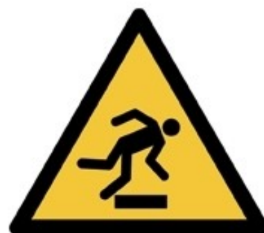
W007 - Ostacolo in basso