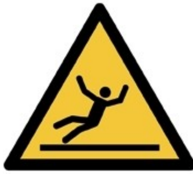
W011 - Superficie scivolosa