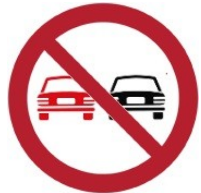
Divieto di sorpasso