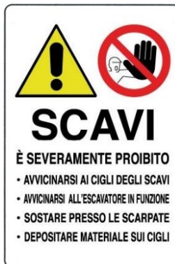
Divieto di accedere o sostare in prossimità di scavi