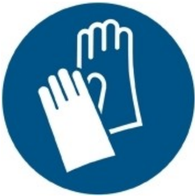
M009 - Indossare guanti protettivi