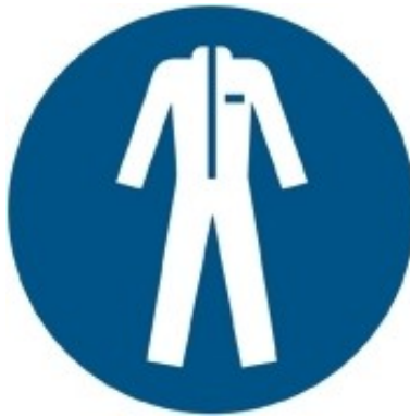
M010 - Indossare indumenti protettivi