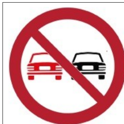
Divieto di sorpasso