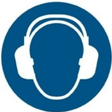
M003 - Indossare protezioni dell'udito