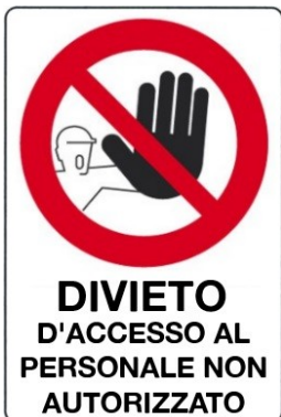
Divieto d'accesso al personale non autorizzato