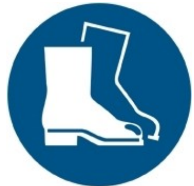
M008 - Indossare calzature di sicurezza