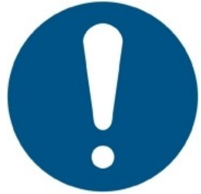
M001 - Obbligo generico