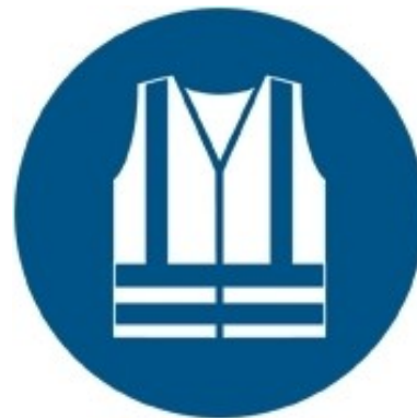
M015 - Indossare indumenti ad alta visibilità