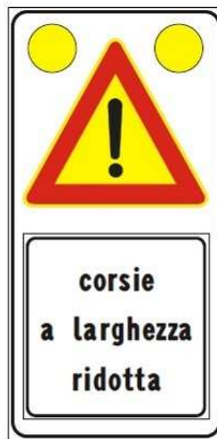
Figura II 391c Art. 31