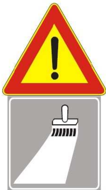
Figura II 391 Art. 31