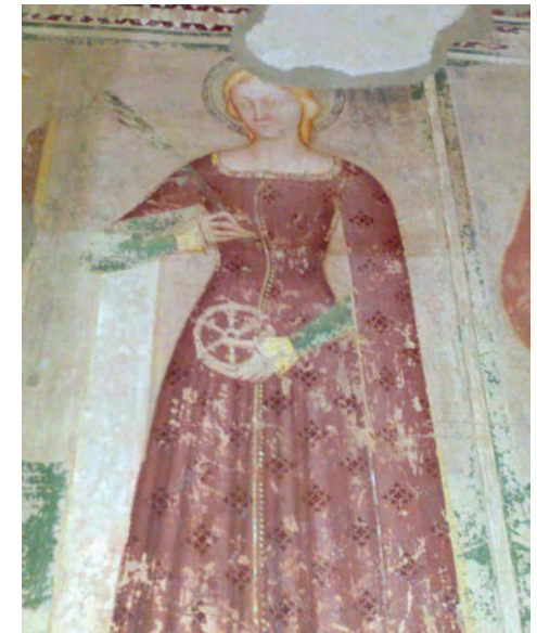
S. Caterina d'Alessandria Santuario della Beata Vergine del Pilastrello