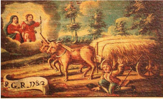
Ex Voto - Oratorio di San Rocco 1782